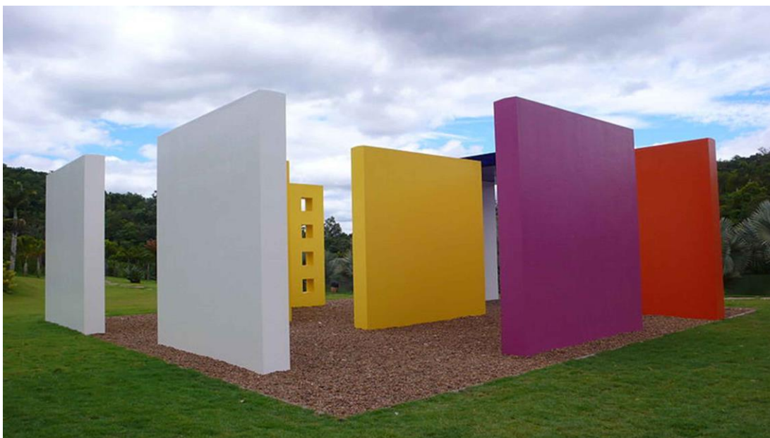
Figura 2 Hélio Oiticica (1960) Núcleo

Oiticica creaba un tipo de arte que se desarrollaba coetáneamente y en paralelo, con el movimiento minimalista que se gestaba en Europa y Estados Unidos. Los artistas, desde ambos lados del Atlántico, producían obras que se acercaban al público y que necesitaban de él para entenderlas en su totalidad, como se pudo ver en el apartado anterior. El espectador, recorría asombrado los grandes volúmenes hipergeometrizados y de colores saturados (principalmente primarios y secundarios) que Oiticica asentaba en el espacio externo, dejando atrás el espacio cerrado del interior de las galerías, museos y salas de exposiciones.