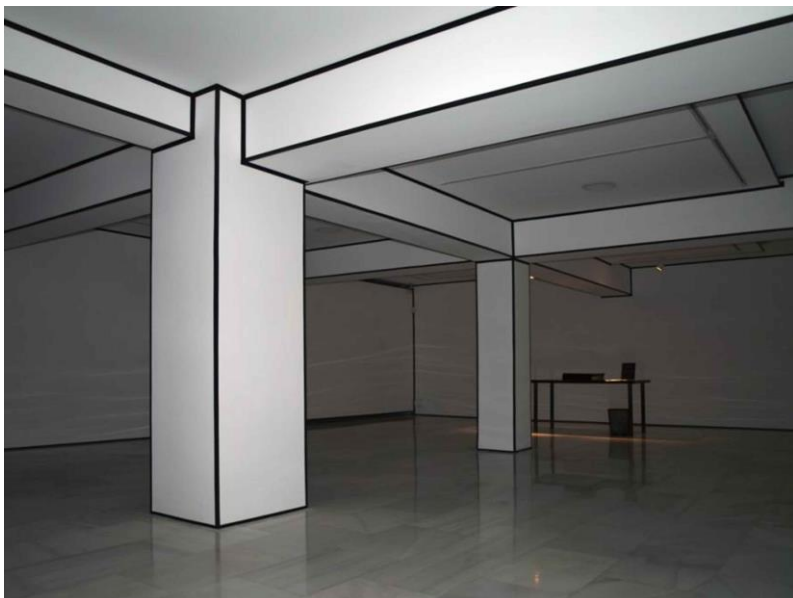
Figura 3 Marlon de Azambuja (2007) Intención de panorama Cinta adhesiva sobre espacio arquitectónico Sala de Arte Joven (Madrid)

en 2007, intervino con la cinta de embalaje (en esta ocasión de color negro) el espacio arquitectónico que conformaba el cubo blanco de esta sala de exposiciones. Con ella marcó la silueta de la sala, toda su forma, desde suelo a techo e incluyendo el contorno de los pilares que sostenían a la edificación. Además, esta exposición se acompañaba de un libro con una serie de fotografías intervenidas con rotulador negro, en las que Azambuja estudió la disposición y la arquitectura de las exposiciones que se recogieron en las galerías de Madrid en ese mismo año (2007). En la imagen siguiente se puede ver cómo el artista brasileño delimitó este sobrio y blanco espacio con las cintas de color negro (Fig. 3).