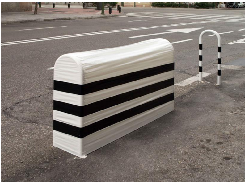
Figura 7 Marlon de Azambuja (2008) Potencial Escultórico Cinta adhesiva sobre mobiliario urbano Intervención realizada en Madrid