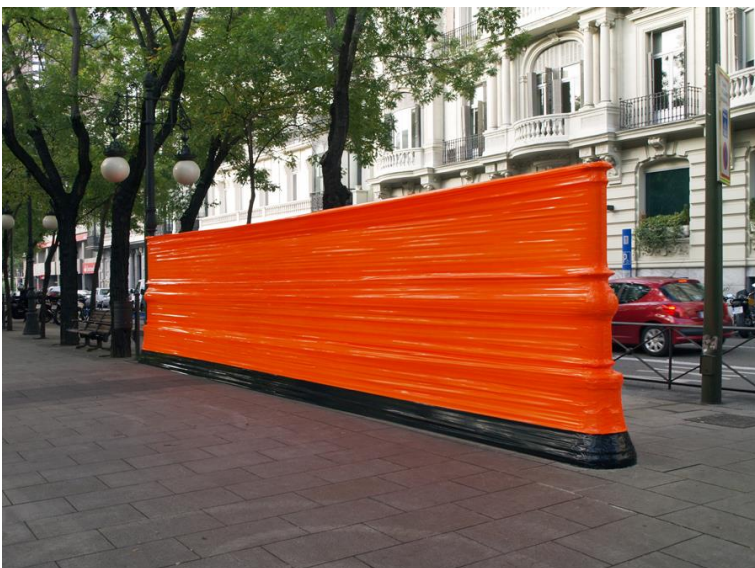
Figura 5 Marlon de Azambuja (2009) Potencial Escultórico Cinta adhesiva sobre mobiliario urbano Intervención realizada en Madrid