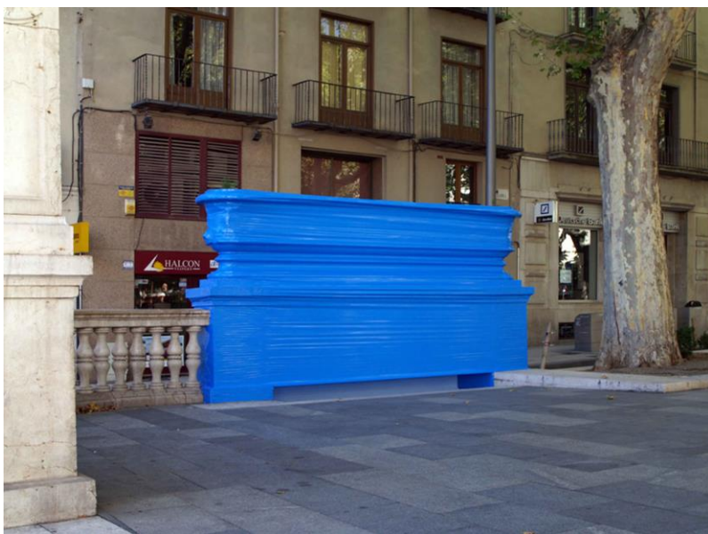
Figura 6 Marlon de Azambuja (2010) Potencial Escultórico Cinta adhesiva sobre mobiliario urbano Intervención realizada en Madrid

El espectador se convierte en una pieza esencial para que la obra adquiera su pleno sentido, según afirmó el propio artista en la entrevista ya citada para el periódico digital El Cultural 2 . Este espectador-transeúnte puede interactuar con las obras, mirándolas, tocándolas, e incluso, si lo considera necesario, puede romperlas, puesto que éstas les impiden el paso, como por ejemplo se puede ver en la Figura 6.