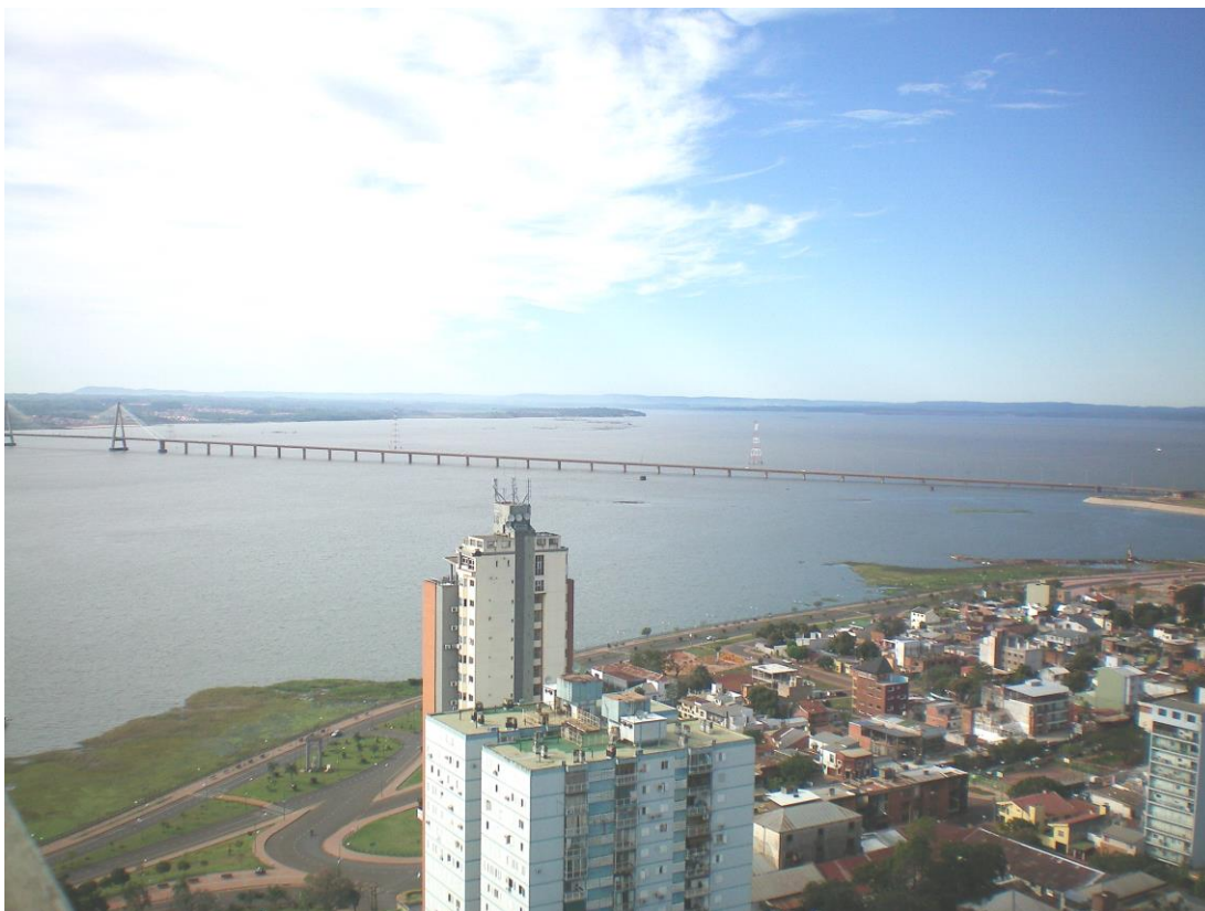
Foto 1. Vista del Puente Internacional desde Posadas.

1990 del puente Internacional San Roque González de Santa Cruz 3 . Construido sobre el río Paraná, con una longitud total de 2550 metros, fue una megaobra históricamente anhelada entre ambos países y desarrollada en paralelo a los efectos de la represa Yaciretá. Actualmente, el puente posibilita una inédita articulación territorial entre ambas ciudades integrándolas a una nueva conurbación internacional.