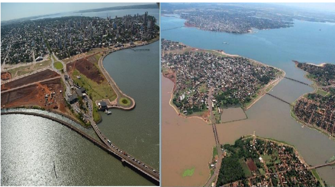
Zona de obras en la cabecera del puente internacional. Posadas

reposición de la Ruta N° 1 afectada por el embalse generado en el Arroyo Quiteria. Otro acceso vial es el Calle Curupayty, que comprende el retrazo a mayor altura del tramo de la continuación de la ruta Curupayty, situado sobre el arroyo Poti-y afectado por el embalse entre los distritos de Encarnación y Cambyretá 7 . Sobre la Ruta 14, a alturas del Arroyo Poti-y, se han reconstruido varios tramos viales urbanos, entre ellos algunos puentes de hormigón pretensado que van entre 30 y 50 metros de longitud. Otra gran obra de reposición de infraestructura es el Aguapey I, un canal de 12 kilómetros de longitud que une el subembalse del Aguapey con el canal de drenaje situado al pie de la presa, construido para evitar una mayor inundación del territorio paraguayo. Por otro lado, se ha construido el Aguapey II, una presa de tierra destinada a evitar la inundación de otras zonas de influencia urbana en la región. Además, se ha provisto de una estructura de toma de riego. En la actualidad, hay otras obras viales en ejecución, además de defensas costeras, la ampliación de ruta Costanera, playas y otros espacios públicos de ocio.