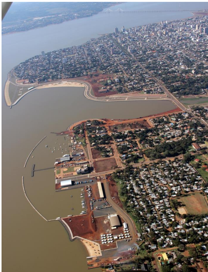
Foto 2. Bahía el Brete y tratamiento costero, Posadas

Hacia el año 2010, el PTY estuvo abocado a acelerar la finalización de las denominadas obras complementarias, por lo que en la ciudad de Posadas se ejecutaron importantes obras (acceso sur/norte, bahía el Brete, puentes, conjuntos habitacionales, entubamiento de arroyos, saneamiento ambiental, etc.). Como corolario, estas obras en su conjunto están transformando irreversiblemente la tradicional morfología urbana de ambas ciudades.