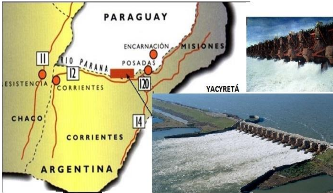
Mapa 2. Localización de la Represa de Yaciretá.

2,50 metros, podemos tener una idea más acabada de los cambios: con el llenado del embalse, la cota final del río alcanzó 9,50 metros, lo que equivale en ese punto el aumento de 7 metros por encima de los niveles normales.