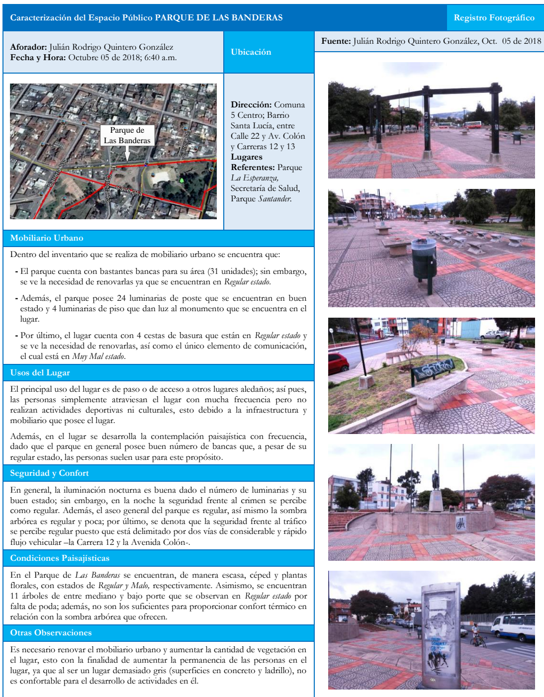
Figura 4. Ficha de Registro de Observación Parque de Las Banderas. Octubre de 2018