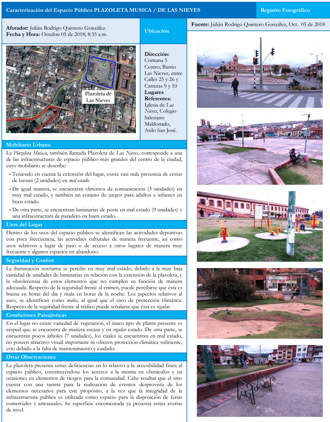
Figura 7. Ficha de Registro de Observación Plazoleta Muisca / De Las Nieves. Octubre de 2018