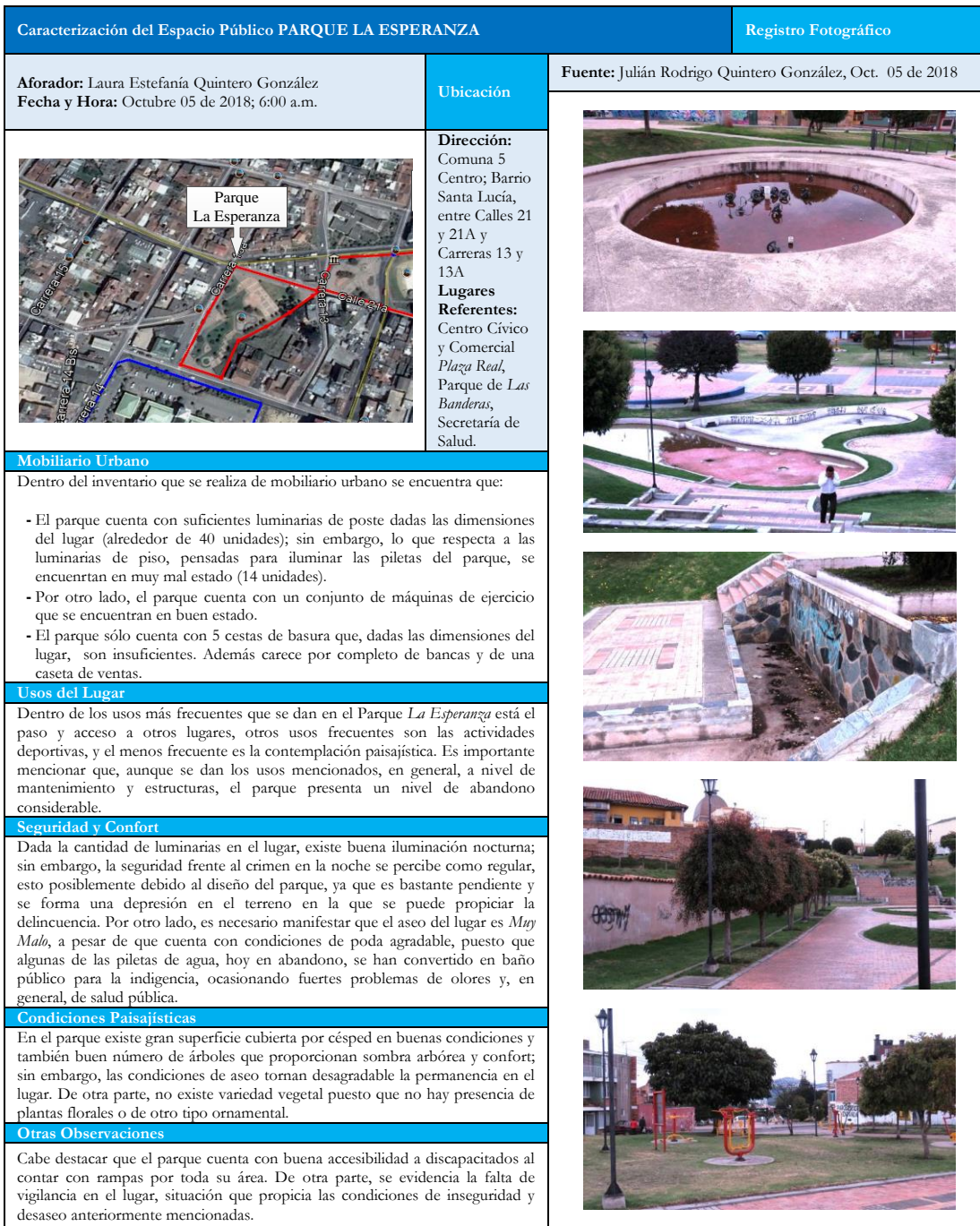
Figura 3. Ficha de Registro de Observación Parque La Esperanza. Octubre de 2018