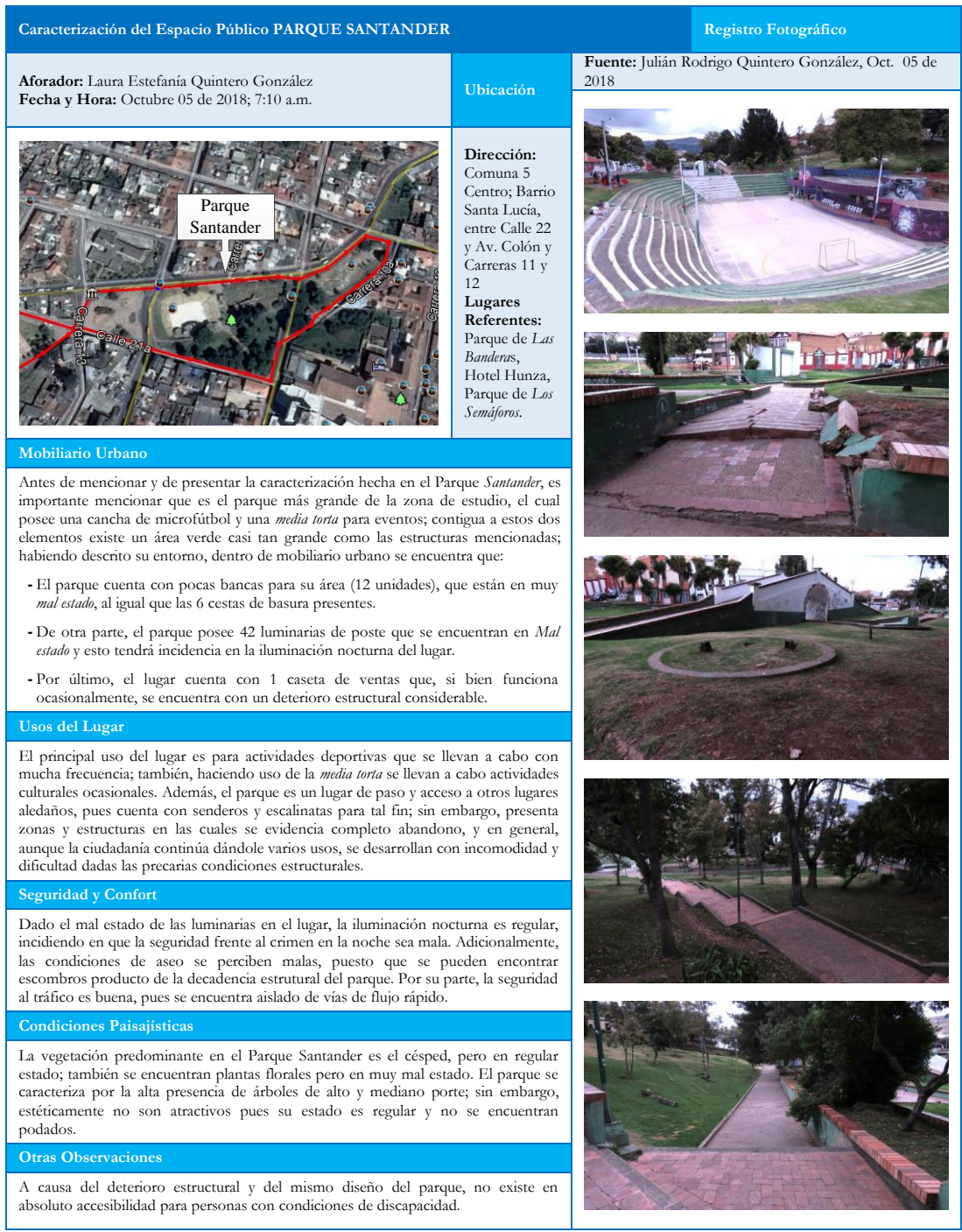
Figura 5. Ficha de Registro de Observación Parque Santander. Octubre de 2018