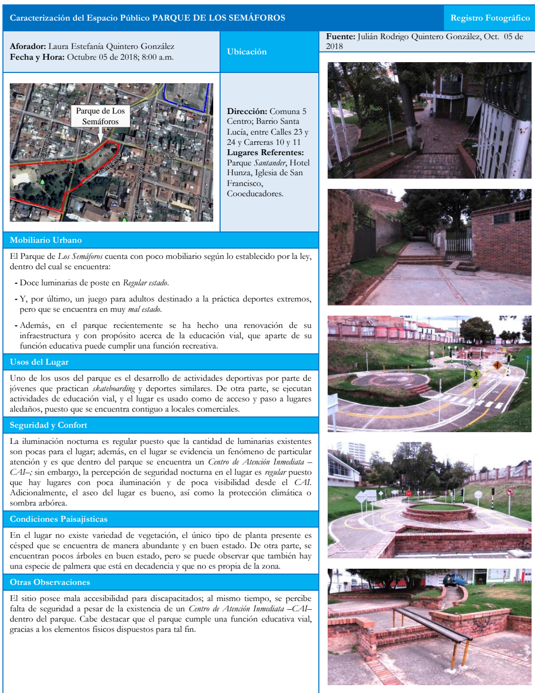
Figura 6. Ficha de Registro de Observación Parque de Los Semáforos. Octubre de 2018