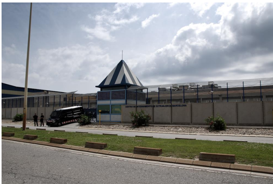
Centro de Internamiento de Extranjeros de Barcelona, en Zona Franca.

encierro en los que una persona puede ser privada de libertad por una simple irregularidad administrativa, sin haber cometido ningún delito. Son espacios opacos que llevan operando desde 1985, donde se han hecho múltiples denuncias de tortura, malos tratos, vejaciones, falta de asistencia sanitaria y social, y un sinfín de vulneraciones de los derechos humanos (si no se quiere ver la propia existencia de estos centros como una violación intrínseca de los derechos básicos) e irregularidades en la gestión policial de estos centros. En España hay ocho centros activos, y más de trescientos en Europa. Pero estos centros son solo la punta del iceberg. El entramado es mucho más complejo y se compone de un dispositivo basado en la gestión policial (redadas racistas y vuelos de deportación), la sistemática criminalización a través de los medios de comunicación y la violencia burocrática 4 en los procesos de obtención de un permiso de residencia. Todo esto conlleva graves imposiciones políticas, económicas y culturales basadas en un pensamiento propio de la etapa colonial.