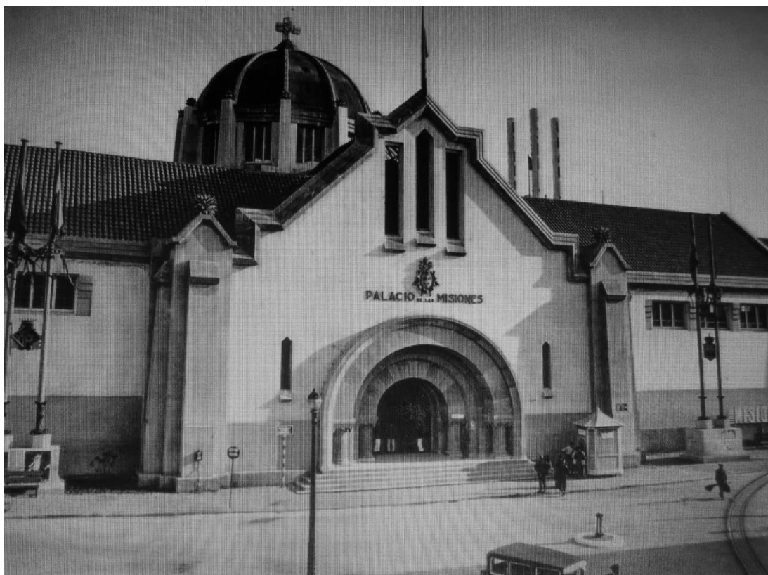
Palacio de las Misiones, fotografía de Antoni Dardier, 1928.

esperaban controles policiales para examinar y determinar si venían en una situación regular o irregular. Básicamente, las personas que tenían derecho a acceder libremente eran aquellas que contaban con una oferta de trabajo fija. Las que no, eran llevadas al campo de concentración de Montjuïc, el conocido como Palacio de la Misiones.