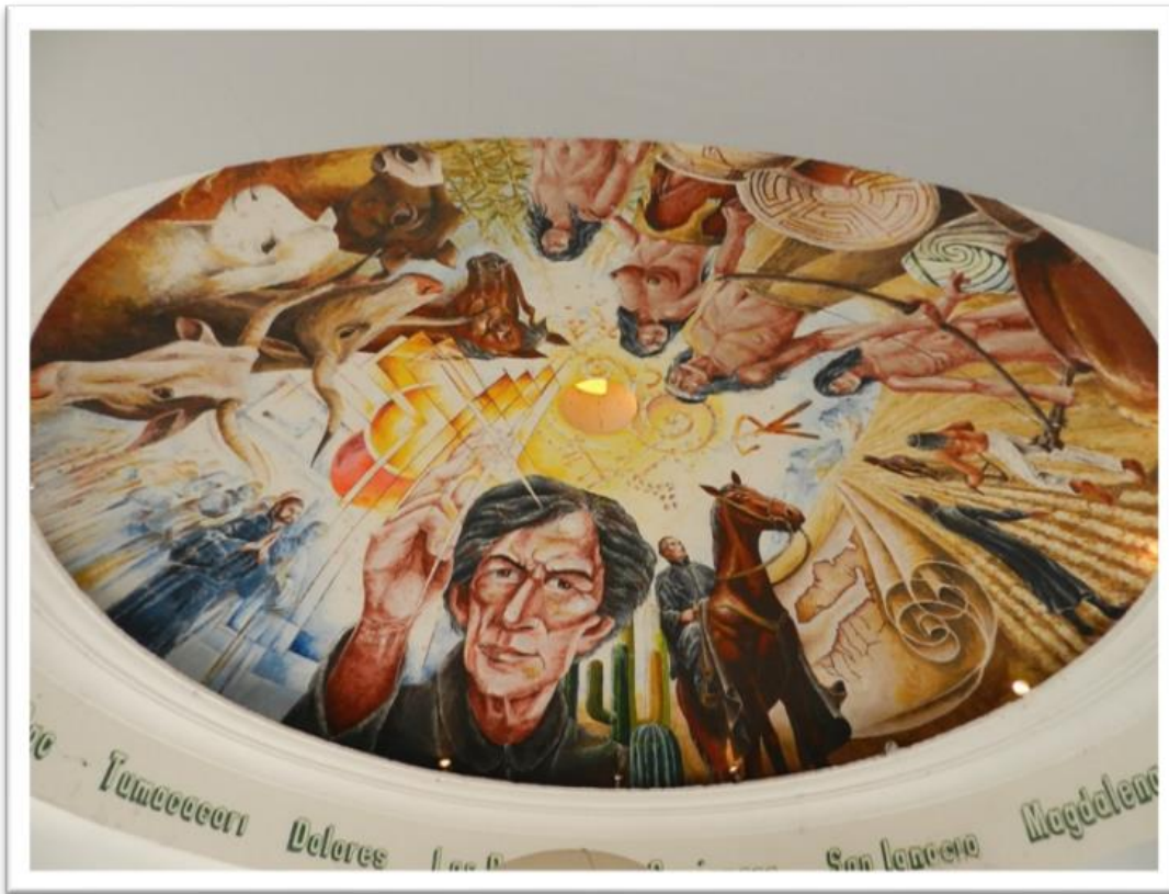
Mural en la cúpula del mausoleo al padre Kino donde se encuentran sus restos.

permitió crear una importante economía turística basada en los servicios comerciales, hoteleros y gastronómicos dirigidos a las visitas.