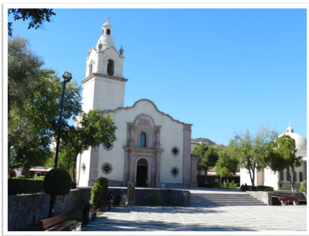
Iglesia de Santa María de Magdalena y, adjunta, la capilla de San Francisco en la Plaza Monumental.

La denominada Plaza Monumental es el lugar más importante de Magdalena de Kino. Alberga la Iglesia de Santa María de Magdalena, la capilla de San Francisco, el mausoleo con los restos del padre Kino, una estatua de Luis Donaldo Colosio (el malogrado candidato a la presidencia de México por el PRI) y un conjunto de edificios con negocios de artesanías mexicanas.