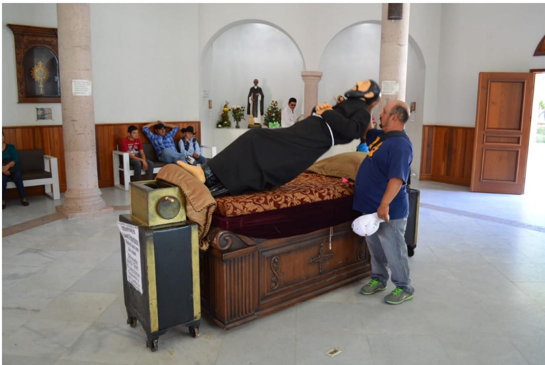
Prueba de fe.

Se cambió la imagen del primer cuadro de la ciudad de acuerdo a un imaginario que pretende revalorizar los símbolos, recuperar la historia y enaltecer el pasado mediante escenografías y montajes que simulen y armonicen la fisonomía urbana, básicamente destaquen las figuras veneradas por el turismo religioso y los símbolos de identidad como el Padre Kino. A la construcción de la capilla contigua a la Iglesia que aloja al santo motivo de devoción y fe, le siguió la recuperación de la imagen del Padre Kino como emblema dispuesto en el mobiliario urbano y en diversos murales dispuestos en edificios públicos, se modificó la publicidad y el uso de anuncios para que los comercios y servicios no contaminen la imagen visual del primer cuadro de la ciudad y se sustituyó por pequeños letreros que incorporan el logo del Programa Pueblos Mágicos y el nombre del establecimiento comercial, entre otras cosas. La mayoría de las obras se han realizado en el centro histórico, en los alrededores de la Plaza Monumental y el Palacio Municipal.