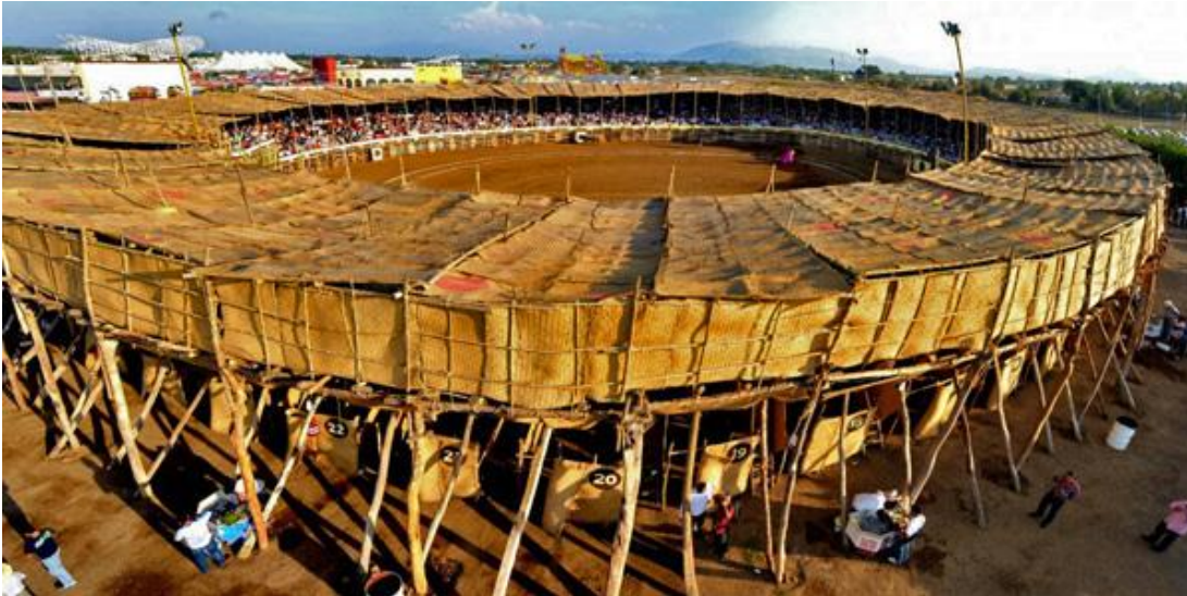
Carlos Mijares Bracho, La Petatera de la Villa de Álvarez en Colima –sabiduría decantada . México, 2000.

Carlos Mijares fue el arquitecto elegido para recibir el encargo de convertir el pequeño pueblo en un gran referente turístico, para ello debería transformar la plaza, cuyo asentamiento era de carácter temporal, en una estructura moderna e innovadora enclavada al emplazamiento. En vez de seguir esas imposiciones y realizar otro proyecto “de fábrica”, prefirió “perder” unos días en visitar la plaza que debería sustituir por toneladas de hormigón, acero y vidrio. Una vez allí, se impregnó del proceso participativo de su construcción y de su relación inmediata con el entorno.