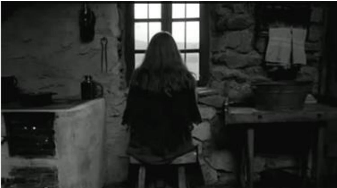
A Torinói ló (The Turin Horse), Béla Tarr, Ágnes Hranitzky. 18'43"

De mención obligatoria es la referencia a la película El caballo de Turín 1 , ese Rocinante que ha dejado de comer, que ha dejado de luchar, pues la vida también se considera una posible elección. La película de Béla Tarr va al extremo del cuestionamiento, donde padre e hija van viendo cómo, a través de un orificio en un muro, una ventana, el mundo conocido va desapareciendo: el caballo deja de comer, el pozo deja de dar agua, la brasa no arde y la luz del sol deja de brillar. La naturaleza desobedece, el hombre sin evolución vuelve a la nada.