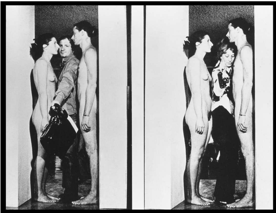
Marina Abramovich & Ulay, Performance in MVRDV . Farnax, Rotterdam- 010 Publishers, 1998.

Esa arquitectura primitiva que modifica, que propone una nueva expresión de la libertad de acción; una acción que interviene, manipula, superpone y recrea lo real. El cuerpo es nuestra primera herramienta de expresión que, como si de un collage se tratase, va copilando y unificando diferentes análisis y modos de resurgir de estos tiempos locos.