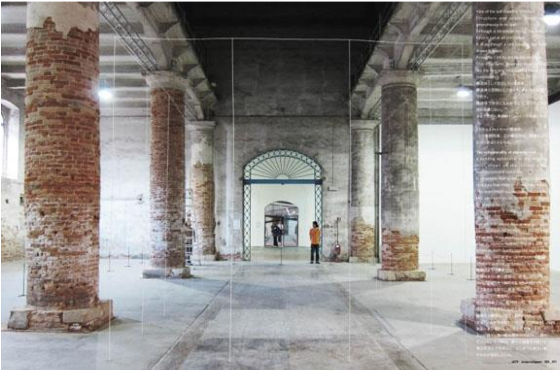
Junya Ishigami, Architecture as air . Bienal de Arquitectura de Venecia, 2010

Como ejemplo, podemos estudiar las arquitecturas de Ishigami Junya, arquitecto japonés que tiene como patrón la naturaleza. Con su análisis no sólo abre una ventana a nuevas bellezas corpóreas, sino que incorpora las fuerzas de lo primario como un proceso para llegar a una nueva concepción de la arquitectura, de lo heterogéneo y experimental, como fuente inagotable de creación.