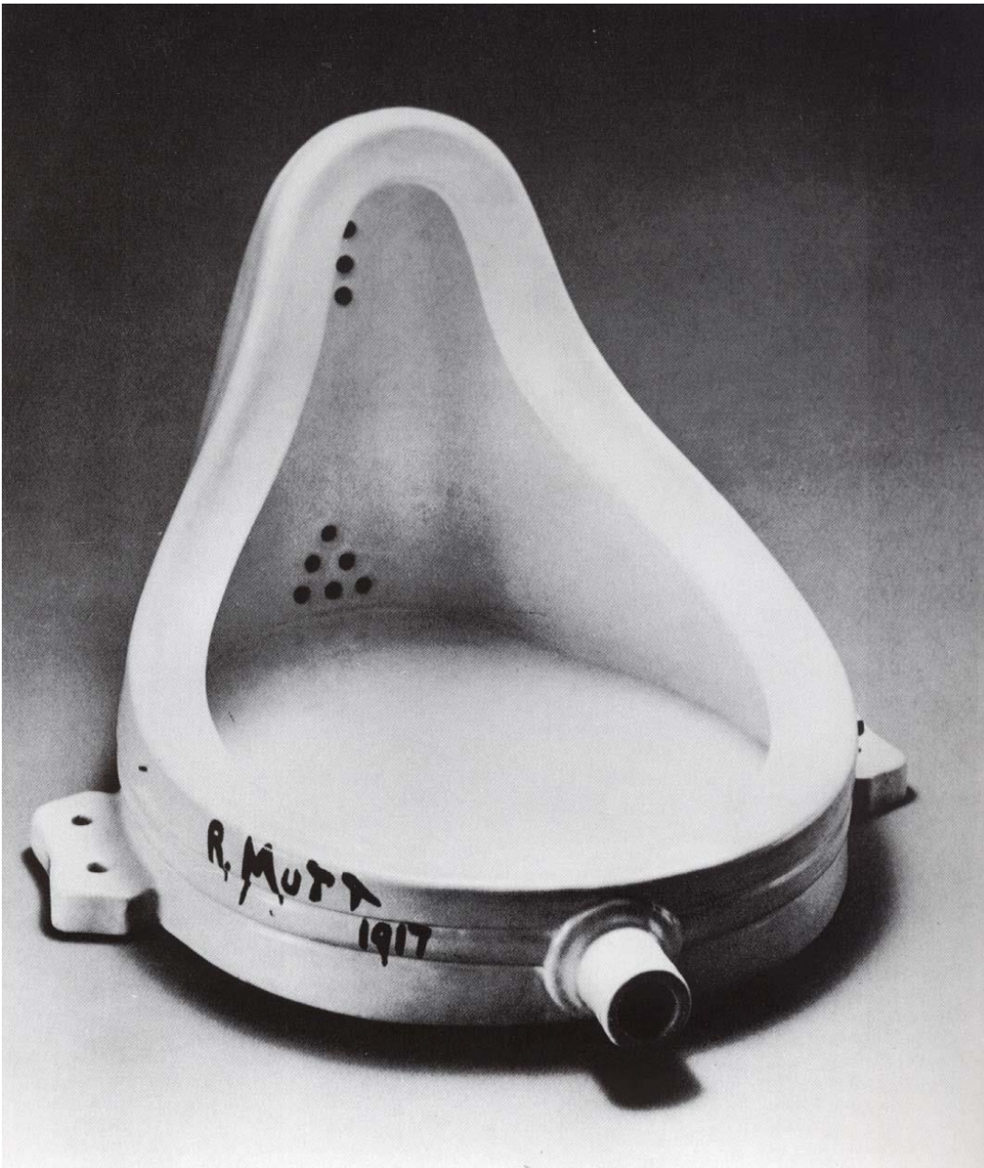
Marcell Duchamp, La fuente . Nueva York, 1917.

¿Qué nos hace ser aceptados por una sociedad de consumo?, ¿por qué debemos seguir ciertos modelos de comportamiento?, ¿dónde se encuentra la creatividad, las nuevas formas de reivindicar que no se encuentra dentro de tus valores, de la arquitectura, la vida y esa esencia humana para ti están más allá de las “fábricas en serie de proyectos”?