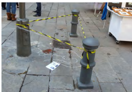
Figuras 6 y 7. Formas de expresión movimiento Plaza Sant Josep Oriol, 2011

Haciendo uso del componente político que tiene el espacio público, como espacio donde es posible la manifestación de ideas, ciertos grupos lo usan para expresar y generar reflexión (ver figuras 6 y 7), simpatía o adherencia y con ello atraer nuevos integrantes, aunque ciertas prácticas relacionadas con estas actividades están prohibidas: