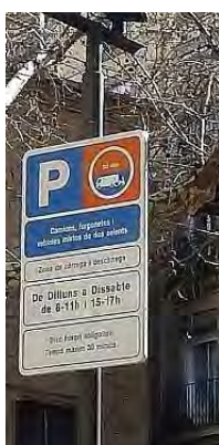
Figura 2. Horario vehicular

Otro aspecto está relacionado con los establecimientos que ofertan servicios que hacen una privatización del espacio en las horas donde el acceso vehicular está restringido.