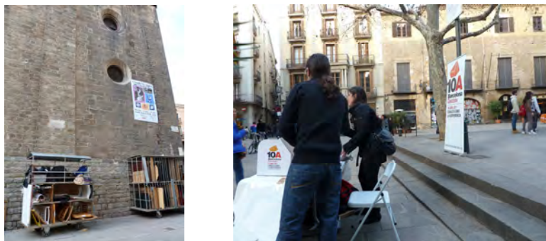
Figuras 8 y 9. Algunos implementos que facilitan el movimiento Plaza Sant Josep Oriol, 2011

En la expresión de posturas políticas en el espacio público se conjugan tácticas de estabilidad y movimiento. La estabilidad se observa en el tiempo de permanencia en la Plaza que permite a los integrantes de diferentes grupos obtener aquello que se requiere de las personas, por ejemplo: una firma o explicar sus ideas. El movimiento se evidencia en los elementos para desplazarse e instalarse rápidamente en el espacio público (sillas y mesas plegables, lámparas portátiles, atriles y otros elementos con ruedas; ver figuras 8 y 9).