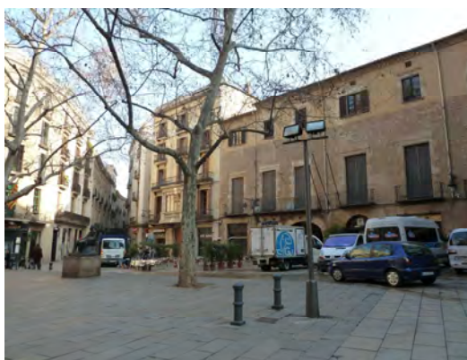
Figura 3. Uso vehicular