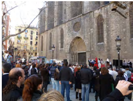
Figura 5. Fiestas de Sant Josep Oriol 2011.

Las personas que residen en los alrededores de la Plaza producen un lugar de prácticas asociadas con el transitar, pues están con menos frecuencia en este espacio, pero cuando lo hacen, se dirigen hacia otro lugar, re-adaptándolo para disfrutar del espacio de forma breve (jugando, paseando animales, comiendo sentados en las escaleras). Ese momento en el que transitan por la plaza, es el instante donde brota la sociabilidad, se evidencia la existencia de vínculos con ese Otro con el que se coincide en la práctica del transitar.