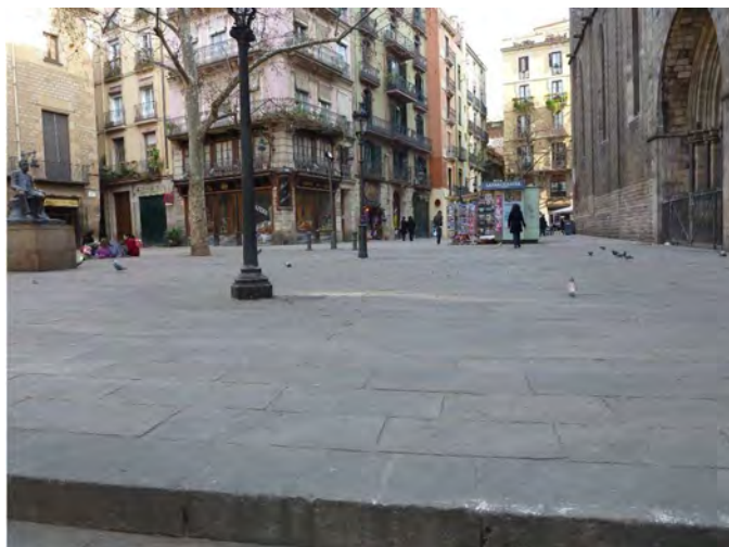
Figura 1. Perspectiva Plaza Sant Josep Oriol

obras o firmas de artistas importantes de Cataluña, cuya veracidad se puede comprobar en los libros y en el Archivo Histórico de la Ciudad.